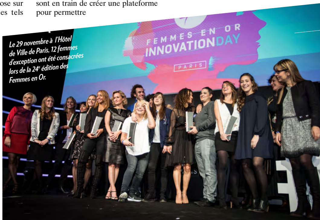
Le 29 novembre à l'Hôtel de Ville de Paris, 12 femmes d'exception ont été consacrées lors de la 24 e édition des Femmes en Or.

Ticketforchange.org Cours en ligne gratuits : coursera.org/learn/entrepreneur-changement